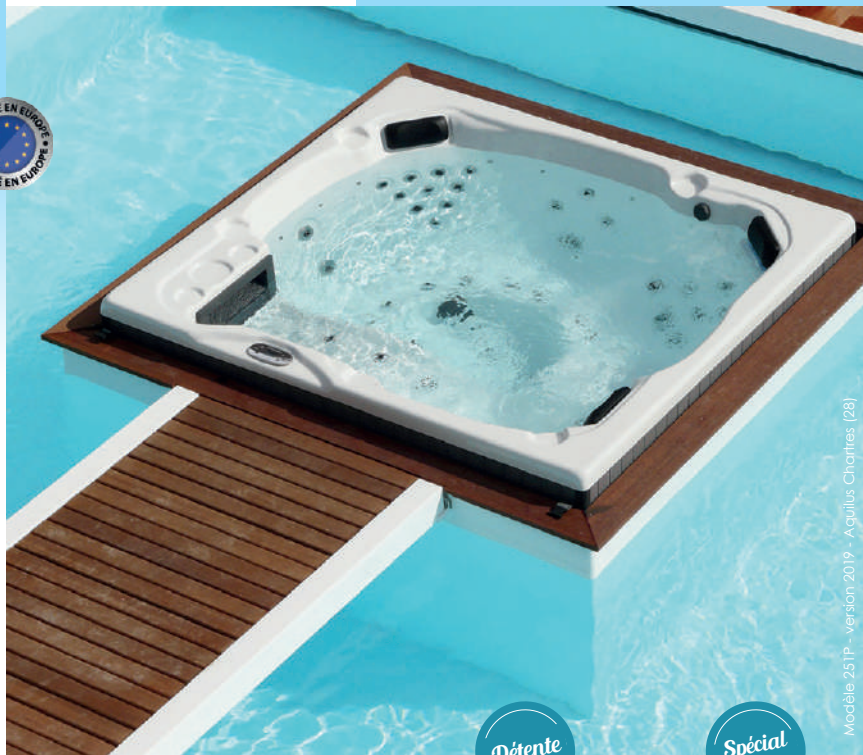
Modèle 251P - version 2019 - Aquilus Chantres (28)